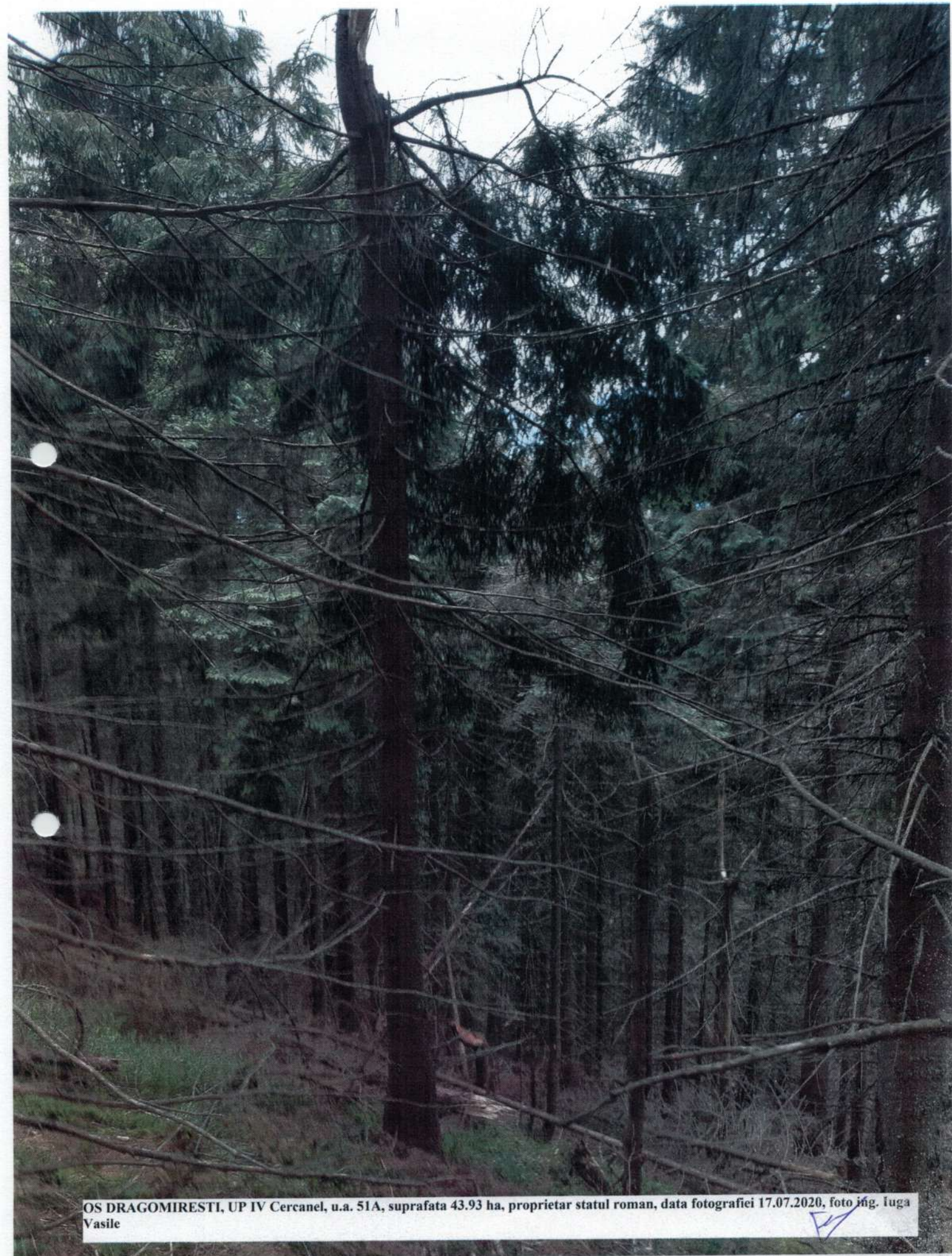
OS DRAGOMIRESTI, UP IV Cercanel, u.a. 51A, suprafata 43.93 ha, proprietar statul roman, data fotografiei 17.07.2020